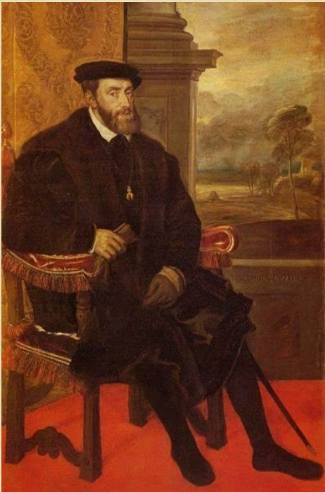
Charles Quint https://www.histoire-pour-tous.fr/

Je travaille pour Charles 1er d'Espagne. C'est d'ailleurs lui qui a financé mon voyage. Il m'a missionné de trouver un chemin plus court pour accéder aux « îles aux épices » : les îles Moluques, c'est un archipel qui se trouve à l'est de l'Indonésie actuelle.