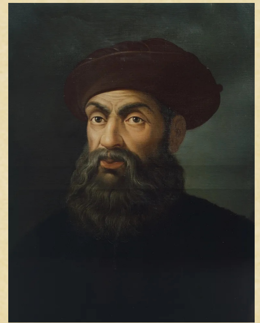
Fernand de Magellan https://www.nationalgeographic.fr/histoire/culture-generale-magellan-t-il-vraiment-ete-le-premier-faire-le-tour-du-monde

• Je m'appelle Fernand de Magellan. Je suis né le 4 février 1480 à Sabrosa au Portugal, dans une famille de la petite noblesse. J'ai deux enfants.