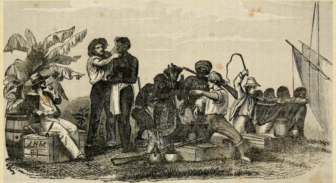
Esclavage des américains

Les conséquences de ce voyage et de cette rencontre ont contribué à renforcer le mystère et réveiller la curiosité des Européens. L'arrivée des Européens sur les côtes change les conditions de